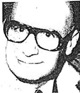
Peter L. Berger

Peter Berger, que considera la situación actual en España como sumamente esperanzadora y emocionante, se entrevistó con el arzobispo de Madrid-Alcalá, monseñor Tarancón, así como con los líderes socialista y socialdemócrata, Enrique Tierno Galván y Joaquín Ruiz