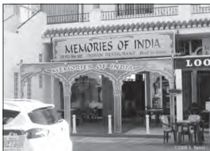
Foto 60. Restaurante hindú en Benalmádena, Málaga.