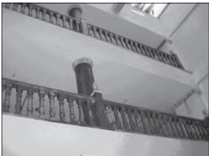
Foto 67. Comunidad Musulmana de Almería As-Salam, en Roquetas de Mar.