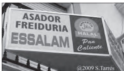
Foto 57. Comercio halal en la localidad onubense de Moguer (foto de Sol Tarrés).

prohibidas se denominan con el nombre común para lo ilícito: haram. 119 Si bien se observa que los musulmanes, en general, respetan la prohibición del consumo de cerdo, y que son cada vez más los establecimientos que ofrecen productos halal, regentados tanto por musulmanes como grandes almacenes, en la práctica algo menos de la mitad de ellos consume exclusivamente alimentos halal. Los musulmanes más practicantes han desarrollado distintas estrategias para garantizarse el consumo halal, como, por ejemplo, la lectura detenida de todos los ingredientes de los productos deseados, las listas de emulgentes alimentarios prohibidos, etc. Y también procuran dotarse de instituciones que garanticen que los alimentos que consumen son lícitos.