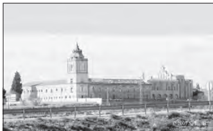
Foto 15. San Isidoro del Campo. Santiponce, Sevilla.