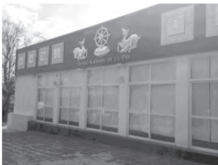
Foto 69. Centro de Meditación Kadampa España. Alhaurín el Grande, Málaga.