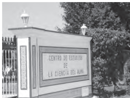
Foto 70. Centro de Estudios de la Ciencia del Alma. Fundación Cultural RSSB Andalucía. Alhaurín de la Torre, Málaga.

dedicado a la paz, la prosperidad y la armonía en el mundo. Se trata de una estupa abierta que cuenta en su interior con una sala de meditación —lo que la hace singular—, una sala de exposiciones con una colección permanente de pinturas budistas, y colecciones temporales de contenido budista; en el exterior se sitúan la tienda y la cafetería.