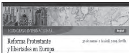
Foto 16. I Congreso Internacional sobre la Reforma Protestante y Libertades en Europa. Sevilla, 2009.