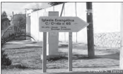
Foto 3. Señal indicadora de una iglesia evangélica en Santiponce.

Actualmente se observa que el proceso de incorporación y permanencia de las distintas comunidades religiosas en los barrios de las ciudades y pueblos andaluces contribuyen a la visibilidad de ellas, así como a una creciente aceptación implícita de esta visibilidad en la vida cotidiana del barrio a partir de la progresiva apropiación de espacios propios. En estos espacios las minorías religiosas van a mostrar y poner de manifiesto aquellos elementos culturales y cultuales que les son propios, manifestando así la voluntad de formar parte del espacio público y relacional de los barrios y municipios en los que viven. No obstante, al coincidir, en gran medida, este proceso de apropiación de espacios públicos con su situación en barrios donde hay una mayoría de población inmigrante, la identificación «inmigrante = otra religión» es inmediata; y, consecuentemente, desde la sociedad mayoritaria, se obvia, o se ignora (explícita o implícitamente) la presencia de comunidades religiosas en barrios donde la