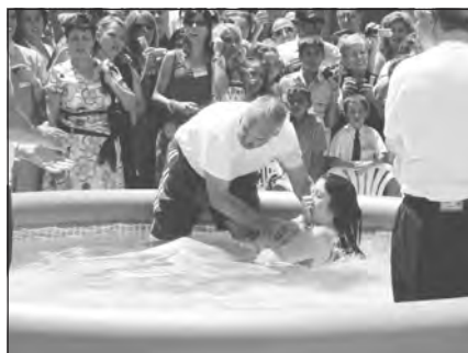
Fotos 48 y 49. Bautismos celebrados en la Asamblea de Circuito de 2007, Feria de Muestras de Granada.