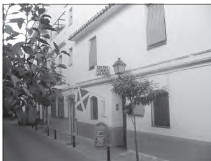
Foto 76. Centro Ecuménico Lux Mundi. Centro de Fuengirola, Málaga.