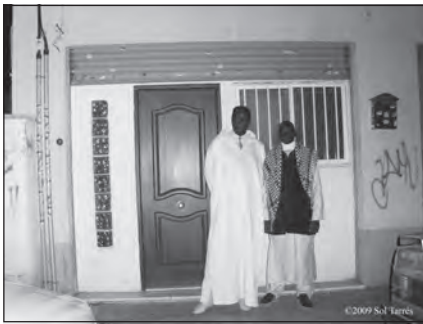
Foto 56. Mezquita Massalicoul Djan. Granada.

a la organización de la inmigración desde origen así como a la creación de lazos solidarios y estrategias de subsistencia y mejora de las condiciones de vida en destino (hay que tener en cuenta que el muridismo santifica el trabajo como camino para la perfección en el islam). El senegalés, al igual que los demás musulmanes, construye su individualidad dentro de la comunidad; lo individual no se entiende sin lo colectivo en todos los ámbitos de la vida social. De ahí que en todos aquellos lugares donde se reúnen dos o tres senegaleses intentan crear una asociación donde reunirse; ésta puede ser de tipo «cultural» (más administrativa y encaminada fundamentalmente a resolver las cuestiones económicas de sus miembros) o «religiosa». Así en el caso de Granada, y vinculada a la Mezquita Massalicoul Djan (más conocida como Mezquita del Zaydín, por el barrio en el que se ubica), pero de existencia independiente está la Asociación M'bolo Moy Dolle («la unión hace la fuerza»), que es la asociación de senegaleses que se ocupa del tema de los mercados, permisos para el mercadillo, relaciones con el ayuntamiento, etc., y que pertenece también a la Confederación de Asociaciones de Senegaleses de España; 117 como asociación forman parte del Consejo Municipal para la Inmigración del Ayuntamiento.