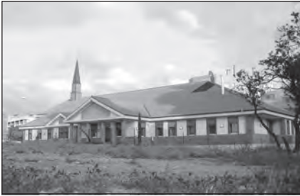
Foto 65. Centro de Reuniones de la Estaca de Granada. Iglesia de Jesucristo de los Santos de los Últimos Días.

Los mormones también disponen de espacios propios construidos para el culto, como es el caso de la Iglesia de Jesucristo de los Santos de los Últimos Días en Huelva. La arquitectura de estas iglesias sigue, en algunos casos, una estética similar a la de las norteamericanas, como es el caso de la que se encuentra en Granada, o bien la recién construida en Sevilla, ubicada en una de las principales vías de acceso a la ciudad (merced a una permuta de terrenos con el Ayuntamiento), y será consagrada en 2009.