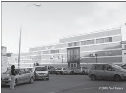
Foto 42. Centro Evangélico Cristiano Shalom. Mairena del Aljarafe, Sevilla.

aparato administrativo del estado español es la situación más urgente a resolver que este grupo de iglesias detecta en el campo religioso. Las consecuencias derivadas de esta situación entorpecen el desarrollo de sus actividades; señalan como dificultades más sobresalientes el reconocimiento legal de los matrimonios celebrados por sus ministros y las dificultades de acceso a los hospitales y a los centros penitenciarios como ministros evangélicos.