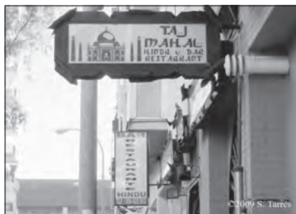
Foto 61. Restaurante hindú Taj Mahal en Sevilla.

A lo largo de la Costa del Sol ha organizado tres centros con temáticas diferentes para la formación de futuros profesores, respondiendo a las distintas necesidades de sus alumnos; el primero se reúne en el Templo Hindú de Benalmádena, que se lo ceden para sus reuniones de los martes y viernes por la mañana para práctica de hata yoga y por las tardes los martes y jueves para la meditación y la asistencia en el mismo templo a la ceremonia del Fuego ( Aarti ). En Marbella, en colaboración con el centro de formación Dev Murti Internacional, se organiza un curso que va dirigido a profesores de yoga que quieran alcanzar el grado de acharya (preceptor espiritual). Finalmente, se organiza un curso mensual, los fines de semana, para formación de yogui siromani, en el Ecocenter «Centro Holístico La Flor de la Vida. Escuela de Yoga» en Tarifa.