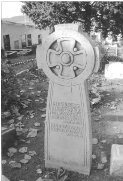
Foto 25. Vista parcial de un elemento funerario en el Cementerio Evangélico de Linares, Jaén.

desarrollo de esta tarea de enseñanza doctrinal, nos han manifestado repetidamente la necesidad de una cierta institucionalización y reconocimiento estatal de los centros de formación teológica evangélica. Junto a este órgano de decisión, existe en algunas congregaciones la figura de uno o varios obreros dedicados a pleno tiempo, o pastores, designados igualmente por la propia comunidad en reconocimiento de su labor.