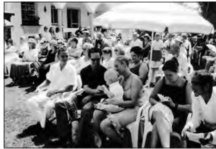
Foto 34. Bautismo en el servicio de Pentecostés de 2003.