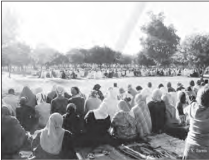
Foto 19. Aid el-Fitr, final del mes de ramadán.