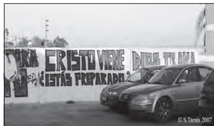
Foto 4. Pintada callejera cercana a la Iglesia Shalom, en Mairena del Aljarafe (Sevilla), (foto: Sol Tarrés).