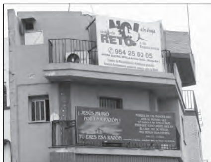
Fotos 36 y 37. Centro RETO a la Esperanza, Sevilla. Vista general y detalle.