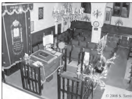
Foto 58. Interior de la Sinagoga de Marbella, Málaga.