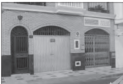
Foto 35. Iglesia Evangélica Jesús Nuestro Pastor Asamblea de Dios. Málaga.

En cuanto a los miembros de las iglesias Asambleas de Dios en Andalucía, mantienen un perfil semejante al de la mayoría de las demás confesiones protestantes tratadas en este estudio. Se trata de una población adulta —con una media de cuarenta años—, participe en la iglesia junto con todo su núcleo familiar, aunque con una leve mayoría de presencia femenina (el 60% en casi todos los casos localizados son mujeres). El origen de estos miembros varía de unas provincias a otras, siendo más fuerte la presencia de españoles en zonas como Sevilla, Cádiz, Córdoba y Jaén. En el resto, o bien las nacionalidades extranjeras (América Latina sobre todo) se entremezclan con la española o bien representan un alto porcentaje, llegando incluso en algunos casos a ser un número bastante alto en la membresía. Tal es el caso de Church on The Rock, en