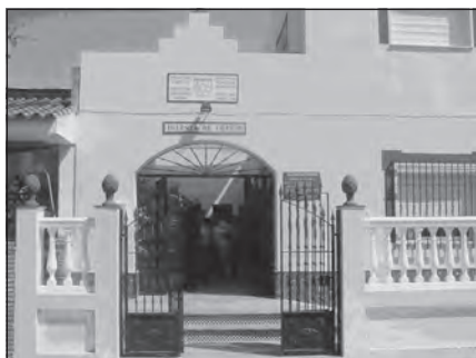
Foto 22. Iglesia de Cristo. Chipiona, Cádiz.