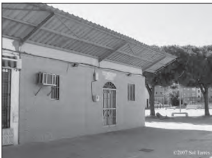
Foto 44. Iglesia Evangélica Filadelfia «El Torrejón», Huelva.