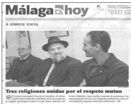
Foto 75. Centro Malaika, Málaga.