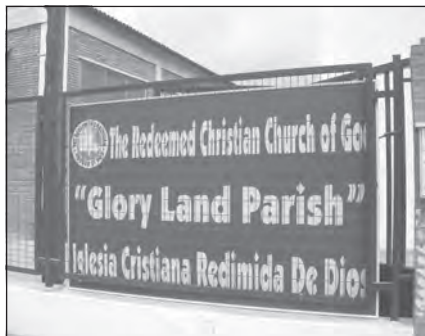
Foto 8. Iglesia Cristiana Redimida de Dios, en Málaga.

municipales sobre civismo y ciudadanía, como la de Sevilla o la de Granada, a punto de aprobarse, vienen a reforzar el control sobre la producción de ruido, tanto en los espacios públicos, como en el interior de las viviendas privadas y locales. 13