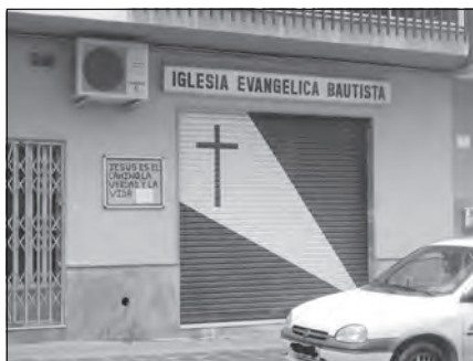
Foto 26. Iglesia Evangélica Bautista. Almería

tres en Córdoba y Sevilla, existiendo al menos una congregación en las capitales de Almería, Jaén, Huelva y Granada, ciudad que cuenta además con un punto de misión en Íllora. Los miembros que habitualmente asisten a los cultos (no sólo las personas bautizadas) ascienden a más de un millar en toda Andalucía, encontrando que iglesias como Granada, Sevilla y Córdoba tienen una membresía que oscila entre la centena y media y dos centenas de personas. Esta variación viene determinada en el caso de Granada según el calendario académico, ya que el 25% de sus miembros son estudiantes procedentes de otras ciudades españolas y extranjeros, principalmente estadounidenses.