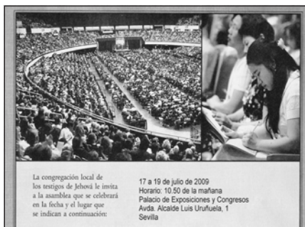
Foto 11. Panfleto, repartido por las viviendas de los municipios, en el que se comunica, e invita, a la Asamblea de Testigos Cristianos de Jehová en Sevilla. Año 2008.

A lo largo del año son numerosos los eventos, los actos públicos organizados por las distintas confesiones religiosas, que contribuyen eficazmente a su visibilidad y, en consecuencia, a su mejor conocimiento y a la normalización de su presencia en el espacio urbano. Así, por ejemplo, la celebración de las Asambleas anuales de los Testigos Cristianos de Jehová, que congregan a varios miles de personas, no pasan desapercibidos, ni en la prensa local ni en el paisaje urbano. Otro caso es la celebración periódica de Expo Biblia, a iniciativa de la Iglesia Adventista del Séptimo Día (que suele contar con una ayuda de la Fundación Pluralismo y Convivencia), en la que durante una semana el objetivo principal es acercar la historia bíblica a la sociedad civil, así como los usos y