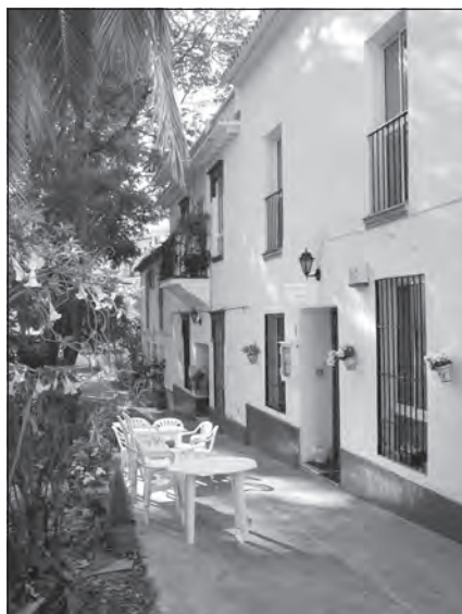
Foto 77. Centro Ecuménico Lux Mundi, Centro de Torre del Mar, Málaga.

la posibilidad de sentirse útiles poniendo sus habilidades al servicio de una institución que sin distinción los acoge y anima a trabajar por los demás. Según esto hay una gama muy rica de actividades y servicios sociales y culturales: idiomas, conocimientos de informática, arte, música, recepcionistas, organización de mercadillos, reciclaje de ropa usada, bricolage, intérpretes, organización de conferencias sobre temática variada, atención a primeras necesidades de inmigrantes, grupo de alcohólicos anónimos, excursiones, encuentros en torno a un café, etc.