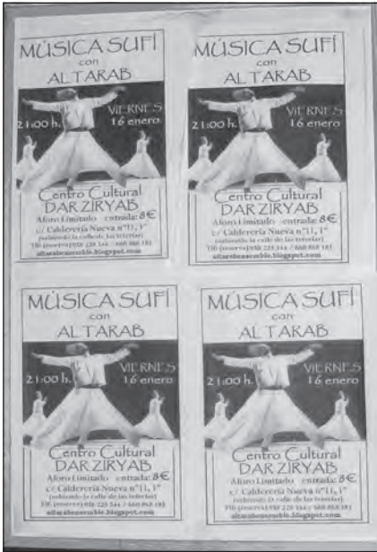
Foto 55. Granada – carteles anunciando un recital de música sufi, con la presencia de derviches giróvagos.

Dios) silencioso, así como de los ejercicios de respiración para despertar los centros energéticos del cuerpo o lataif . Estas prácticas están dirigidas y guiadas por el sheikh o maestro espiritual de manera individual para cada discípulo. La tariqa , además las actividades sufíes también ofrece otro tipo de servicios en el ámbito educativo, como son las clases de árabe para adultos y niños, y de castellano para personas extranjeras.