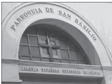
Foto 23. Parroquia iglesia de San Basilio, Sevilla.

2003, la Iglesia de la Ascensión adquirió un terreno con vistas a la construcción de una nueva capilla, dado que el local actual sólo tiene cabida para cincuenta personas y es alquilado. El nuevo solar está enclavado en una ancha avenida de Sevilla. El arquitecto encargado del proyecto es Alberto Campo Baeza, catedrático de la Escuela de Arquitectura de la Universidad Complutense de Madrid y arquitecto muy reconocido a nivel internacional.