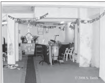
Foto 7. Instrumentos de música. Celestial Church of Christi Amazing Grace Parish Sevilla.