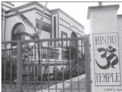
Foto 68. Templo hindú en Benalmádena Costa (Málaga).