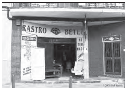
Foto 6. Iglesia Betel, y tienda de objetos de segunda mano.