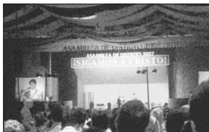
Foto 12. Asamblea de Distrito en Sevilla, año 2007.

A lo largo del año son numerosos los eventos, los actos públicos organizados por las distintas confesiones religiosas, que contribuyen eficazmente a su visibilidad y, en consecuencia, a su mejor conocimiento y a la normalización de su presencia en el espacio urbano. Así, por ejemplo, la celebración de las Asambleas anuales de los Testigos Cristianos de Jehová, que congregan a varios miles de personas, no pasan desapercibidos, ni en la prensa local ni en el paisaje urbano. Otro caso es la celebración periódica de Expo Biblia, a iniciativa de la Iglesia Adventista del Séptimo Día (que suele contar con una ayuda de la Fundación Pluralismo y Convivencia), en la que durante una semana el objetivo principal es acercar la historia bíblica a la sociedad civil, así como los usos y