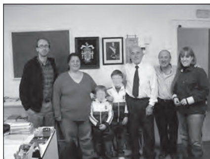
Foto 59. En el Centro Cultural de la Comunidad Judía de Marbella, Málaga.

presentan en español, francés e inglés, y cuenta ya con más de sesenta números. En esta revista se informa de los distintos eventos relacionados directamente con la comunidad de Marbella, con otras comunidades judías, y se publica artículos sobre historia, política, etc. directamente relacionados con el pueblo judío.