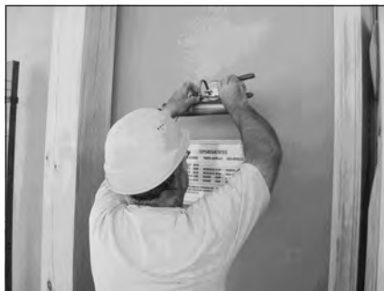
Fotos 46 y 47. Últimos retoques en el nuevo Salón del Reino de Las Gabias horas antes de su inauguración. Granada, julio de 2008.

decir, de la pintura, carpintería, enmoquetado, colocación de asientos, etc., contratando previamente a una empresa constructora la edificación del lugar. Éste es el motivo por el que la modalidad de construcción ha pasado de denominarse «rápida» para calificarse como «semirrápida».