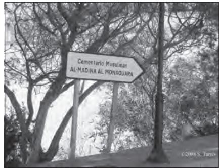
Foto 74. Cementerio musulmán Benalmádena, Málaga.