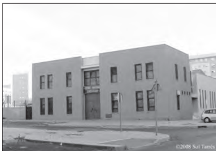
Foto 63. Iglesia Evangélica Getsemaní. Huelva.