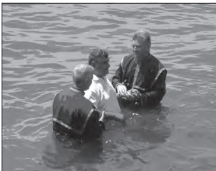
Foto 9. Bautizo por inmersión en el mar, iglesia pentecostal rumana, en la localidad almeriense de Roquetas de Mar.

Sin duda, es la celebración de los distintos y diversos eventos, que acercan las religiones minoritarias a la sociedad mayoritaria, una de las principales formas de visibilizar a los grupos evangélicos y protestantes.