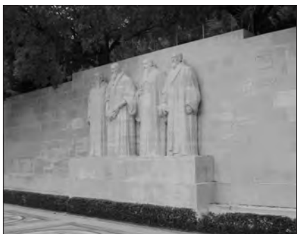
Foto 24. Muro de los Reformadores. Ginebra, Suiza.

institucionalización de las iglesias tradicionales anglicanas y metodistas, y se apostó por una mayor intensificación de la vida de comunión fraterna y por un acercamiento a los principios bíblicos. Pese a que su pretensión originaria estaba muy alejada de la constitución de una nueva denominación evangélica, actualmente los grupos que se identifican con esos principios del movimiento adquieren tal apelativo.