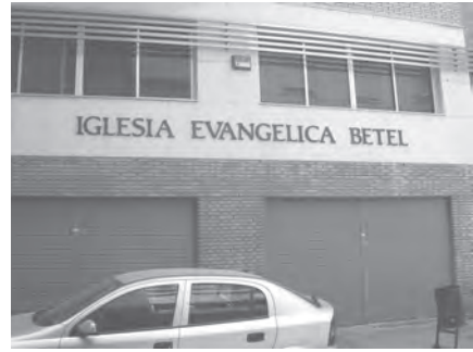
Foto 30. Iglesia Evangélica Betel. Motril, Granada.