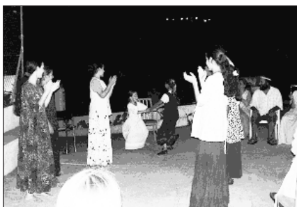
Foto 62. Danzas en la víspera del Sabbath.

Los días ordinarios transcurren con reuniones de toda la comunidad al levantarse y por la tarde-noche para cantar, bailar, contemplar y escuchar explicaciones de la Biblia. El resto del día se dedican a sus tareas de trabajo o formación. El día grande es el Sabbath, el sábado, que empieza ya a ser celebrado en la víspera del viernes por la tarde. Se inicia sobre las siete de la tarde tomando un aperitivo con bebidas e infusiones de flores muy variadas, mientras se ameniza el momento con una flauta y guitarra. A continuación, todos los miembros sin excepción se disponen en corro y se inicia una charla guiada por uno de los presentes, invitando a todos a participar en reflexiones públicas, con intervenciones en inglés, francés o castellano, con traducción simultánea. No tienen un ministro religioso fijo sino que esta tarea la realizan alternativamente diferentes personas. Tras una serie de cantos, ya sean con letras en inglés o castellano, se procede a la lectura de La Biblia y una predicación que culmina con una oración y reflexiones conjuntas. Acto seguido tiene lugar una cena para todos los