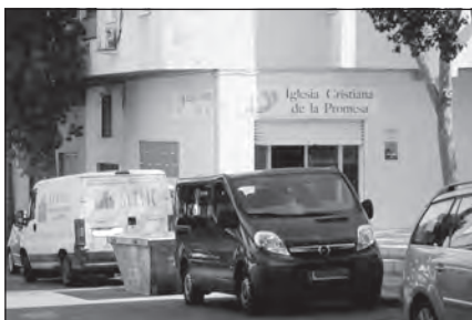
Foto 50. Iglesia Cristiana de la Promesa. Almería

sociales y actividades misioneras. Para la financiación de todos los gastos y proyectos de la iglesia ha creado una empresa de servicios que, además, proporciona trabajo a sus miembros; igualmente, regentan también una panadería desde la que se da testimonio a los clientes.