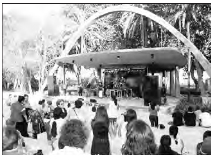
Foto 41. Eventos musicales de las iglesias en el Recinto Eduardo Ocom de Málaga con motivo de la 'Cruzada Sanidad y Milagros', 27 y 28 de junio de 2008.

Anualmente se realizan cultos especiales y conferencias con pastores invitados procedentes de otros países con motivo de la Navidad, Semana Santa o el aniversario de la primera iglesia, así como otros más puntuales como bautismos y casamientos que congregan generalmente a todos los miembros de las diferentes comunidades «Power of Christ Mission». Entre sus actuaciones principales destaca la realización de campañas evangelísticas y la organización en parques públicos de «cruzadas de sanidad y milagros», destinadas a la salud integral del individuo y del grupo, como la llevada a cabo en julio en 2008 en la capital malagueña que contó con la participación de más de una veintena de iglesias pentecostales y carismáticas de la provincia. La experiencia del pastor