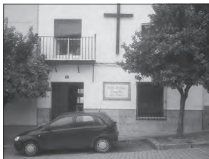
Foto 32. Iglesia Evangélica Misionera Andaluza en Montilla, Córdoba.

que han aceptado y se comprometen con las reglas y estatutos de la comunidad; tienen una serie de derechos (como es la participación democrática en la toma de decisiones) y de vínculos pastorales, así como el compromiso de financiar la vida de la iglesia. Los congregantes son aquellos «hermanos en la fe» que no han dado el paso del compromiso; se trata, generalmente, de personas que no tienen residencia definitiva en cada localidad. La membresía de la Iglesia Misionera Andaluza ronda los dos centenares de personas, mayoritariamente autóctonos, si bien en todas las iglesias hay inmigrantes entre su membresía. Durante las épocas de campañas agrícolas, como la recogida de la aceituna, también se organizan sectores o grupos estacionales con inmigrantes temporeros que acuden a dichas campañas, como es el caso del grupo rumano de Montoro.