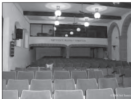
Fotos 27 y 28. Asamblea Cristiana. Jerez de la Frontera, Cádiz.

(Consejería, Enseñanza, Devoción y Amistad). Pastorea también las iglesias de Asamblea Cristiana que actualmente carecen de pastor titular (Villamartín, Sevilla y Morón); convocar las reuniones ministeriales de todas las iglesias de Asamblea Cristiana y las reuniones ministeriales por sectores a nivel local; elaborar los documentos eclesíásticos (estatutos internos, folletos, etc.), los materiales para la formación del Discipulado y los cursos básicos de teología, así como los cursos bíblicos (para novios, matrimonios, familias, visita enfermos, diaconado, etc.); y crear el grupo de apoyo eclesial y alcance misionero a nivel nacional.