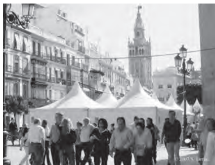
Fotos 13 y 14. Expo Biblia se celebra en uno de los lugares más emblemáticos de la ciudad de Sevilla, la plaza de San Francisco.