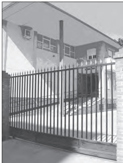
Foto 64. Iglesia Evangélica de Hermanos Hogar La Granja. Linares (Jaén).

(Sevilla). En otros casos, las iglesias evangélicas han construido sus edificios sobre terrenos cedidos por el Ayuntamiento de la localidad, como es el caso de la Iglesia Getsemaní en Huelva, la Comunidad Cristiana Evangélica «Parque Victoria» en El Rincón de la Victoria (Málaga) o el que está construyendo la Iglesia Cristiana Evangélica Betel en San Fernando (Cádiz). Además de las iglesias de nueva planta, los evangélicos cuentan, en Andalucía, con una serie de edificios multifuncionales y de servicio a sus fieles. Ejemplo de ello es el Seminario Evangélico Español situado en La Carlota (Córdoba), o la Iglesia Evangélica de Hermanos Hogar La Granja, en Linares (Jaén), que además de la iglesia propiamente dicha cuenta con una amplia zona residencial destinada a hogar de personas mayores con un huerto, olivar, piscina, etc.