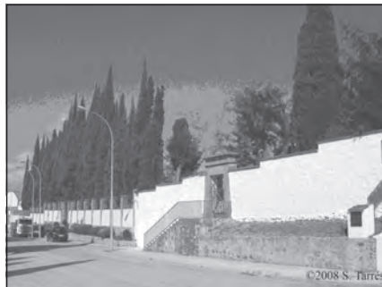
Foto 72. Cementerio evangélico de Linares, Jaén. (foto de Sol Tarrés).

pesar de que se firmaron distintos tratados entre España y Gran Bretaña, no es hasta principios del siglo XIX cuando el cónsul inglés destinado en Málaga, William Mark, establece el cementerio inglés de esta ciudad, y a partir de aquí comienzan a establecerse otros en distintos puntos del país. Se trata de un cementerio-jardín que originalmente se constituyó como jardín botánico pensado como área de recreo, y de propiedad/uso inglés porque es propiedad del consulado inglés. El pabellón de la capilla mortuoria se transformó en la actual Iglesia de San Jorge en 1891, año en que fue inaugurada. Este cementerio es un espacio religioso vivo en el que, además de celebrar los distintos cultos anglicanos, también es un espacio de convivencia de la comunidad; así por ejemplo la tienda de objetos de segunda mano y de artesanías realizadas por miembros de la comunidad está abierta todo el año, asimismo se celebran distintos eventos en las zonas ajardinadas, como es el « Remembrance Sunday » en recuerdo a los fallecidos en la Segunda Guerra Mundial. En este cementerio se encuentran las sepulturas del poeta británico Gamel Woolsey y del español Jorge Guillén (y su esposa), así como del historiador Gerald Brenan.