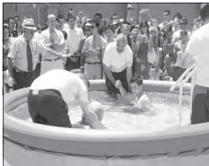
Foto 10. Bautizo en la Asamblea General de los Testigos Cristianos de Jehová de Granada, Almería y Jaén.

permitidos. Los vecinos se quejan de que los rituales, con música y megafonía, se escuchan en sus casas y hacen temblar los muebles» ( Diario Sur , 02/11/2008).