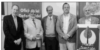
Foto 78. Presentación del Foro para la Ecología, la Espiritualidad y las Religiones, Granada, 2009.

de un nuevo espacio, de un nuevo itinerario espiritual y social». 219 En Ceuta, el 28, 29 y 30 de septiembre de 2007, organizó el «Encuentro “Espiritualidades - Éticas y Lucha por la Justicia”», que tuvo gran repercusión mediática.