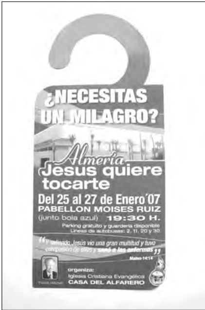
Foto 43. Folleto informativo, repartido por calles y hogares de la capital almeriense, con motivo del evento titulado: ¿Necesitas un Milagro?.

españoles y extranjeros, principalmente latinoamericanos (bolivianos, ecuatorianos, brasileños, peruanos y mexicanos), aunque a la iglesia de Almería acuden búlgaros y rumanos y un importante colectivo procedente de Guinea Bissau visitan la iglesia de Roquetas de Mar.