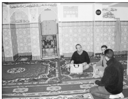
Foto 52. Comunidad Islámica de El Puche. Almería.

para poder permanecer en su interior. Estos oratorios/mezquitas son un lugar de encuentro y de comunicación, un espacio social y sagrado a la vez. Se configuran como espacios multifuncionales en los que además de la práctica religiosa, se favorece el desarrollo de una serie de estrategias de adaptación al entorno, como son las estrategias sociales por medio de las redes de apoyo y solidaridad de grupo, estrategias económicas a través de las redes comerciales establecidas (comercio de productos naturales y halal o «puros», almacenes de mercancías para mercadillos, etc.) o estrategias simbólicas de afirmación de la identidad islámica.