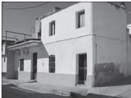
Foto 45. Iglesia Evangélica Filadelfia. Estación Linares-Baeza, Linares, Jaén.

Navidad (calle Santo Ángel) y la de barriada de La Orden, que también se abren por visitas y atenciones ofrecidas desde la iglesia del Torrejón en la capital en la década de los noventa. Existen otros grupos creados desde otras localidades, como, por ejemplo, la iglesia de Lepe que surge también en los noventa gracias a los contactos de algunos de sus miembros con la iglesia de Cartaya.