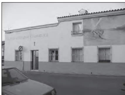
Foto 31. Iglesia Evangélica Misionera Andaluza en Peñarroya, Córdoba.