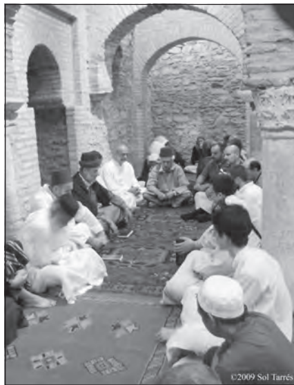
Fotos 53 y 54. XI Jornadas de Cultura Islámica, celebradas en Almonaster la Real, Huelva, en el año 2009. A la izquierda vista de la antigua mezquita, a la derecha cantos sufíes.

demás comunidades sevillanas se van a ir descolgando de esta iniciativa por discrepancias con la Fundación, de modo que, cuando surge toda la polémica en torno a la cesión de terrenos en Los Bermejales, la Comunidad Islámica en España se encuentra prácticamente sola. En la actualidad, y tras la sentencia del Tribunal Superior de Justicia de Andalucía de 30 de septiembre de 2008, que falla en contra de la cesión gratuita de los terrenos públicos, la Comunidad Islámica en España está buscando nuevas ubicaciones en la ciudad hispalense donde construir la mezquita, siendo el barrio de San Jerónimo el elegido por el momento.